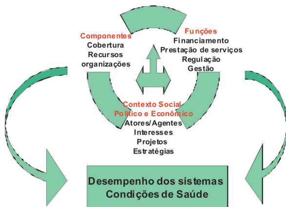
Figura 2 - Dinâmica dos Sistemas de Saúde