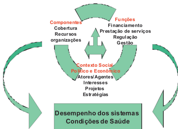
Figura 2 - Dinâmica dos Sistemas de Saúde

Fonte: LOBATO L.V.C.; GIOVANELLA, L. Sistemas de Saúde: origens, componentes e dinâmica. In: Giovanella, Ligia; Lobato, Lenaura; Escorel, Sarah; Noronha, José e Carvalho, Antonio Ivo: Políticas e Sistema de Saúde no Brasil. Rio de Janeiro: Editora Fiocruz, 2008.